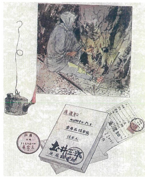
足尾銅山図絵より「坑内の作業」