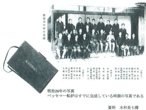
明治26年の写真 ベッセマー転炉はすでに完成している時期の写真である